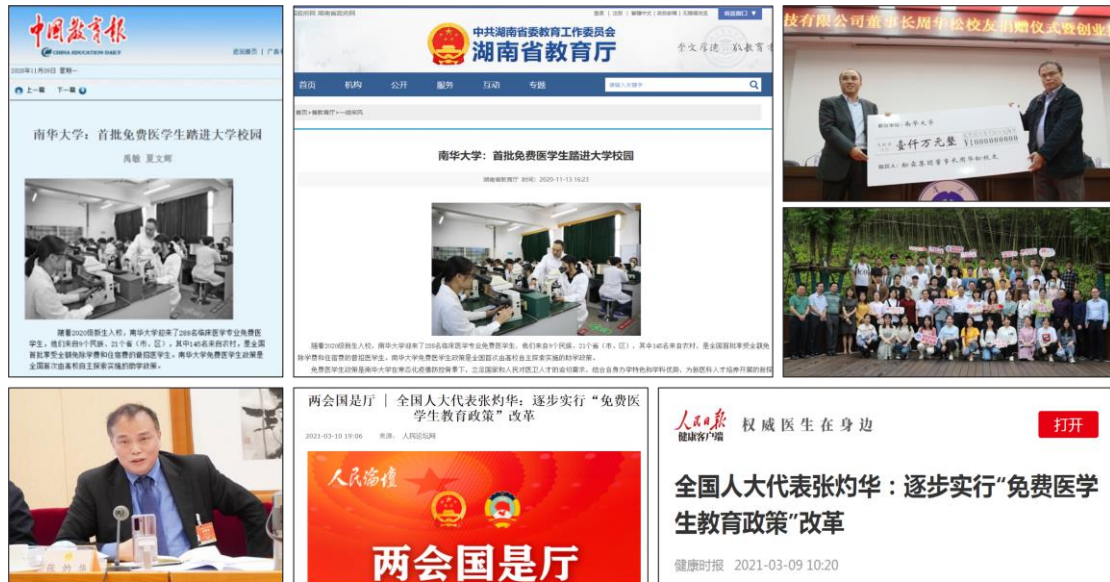
图2 国内首创免费医学生计划

的相比，学生在第二课堂得分、担任干部、入党申请、获各类荣誉等综合素质评价指标上明显提升，特别是学业成绩同比提升了10%。